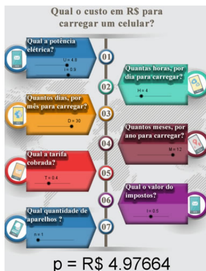
Figura 2 – Preço do consumo de energia de um celular no Geogebra

Para uma avaliação, foram feitas algumas simulações e discussões. Abaixo, mostramos uma delas. Essa simulação escolhida refere-se ao carregador de um dos alunos da sala de aula que não fazia parte do grupo, mas, como a construção do simulador foi feita com toda a turma, o pegamos por apresentar maior potência. O carregador usado foi um LG modelo STA-P51BSE. Em que U = 4,8 V e i = 0,9 A . Adotando como distribuidora de energia elétrica a Companhia Energética de Minas Gerais S.A (CEMIG), temos o valor de T \cong R\$ 0,40 no mês de junho de 2014. Assim, supondo que o tempo gasto é de 4 horas para uma carga completa do aparelho, durante 30 dias, em 12 mês, com uma taxa de impostor sobre a conta de 50%, temos que o custo para carregar o celular da marca LG é de: